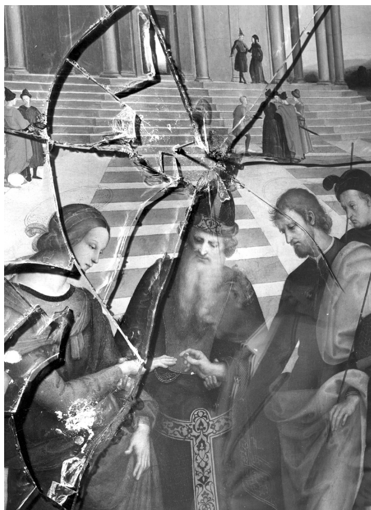
Fig 3. Particolare dei danni occorsi al dipinto in seguito all'atto vandalico.